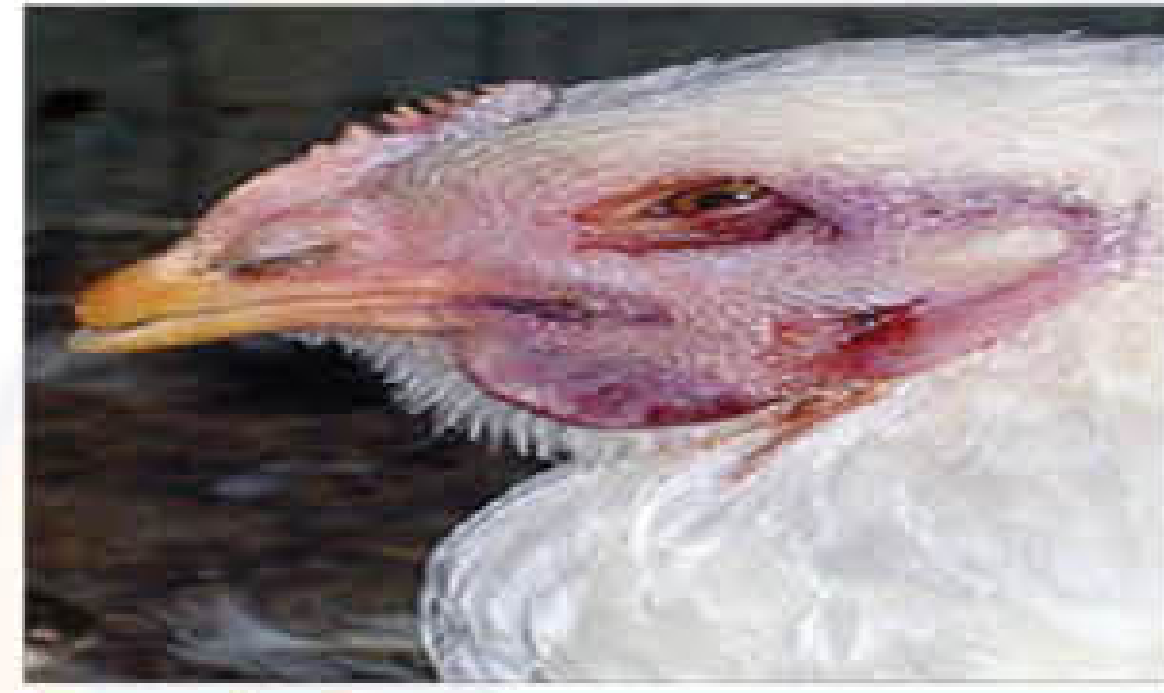
आंखों के पास सूजन और साव