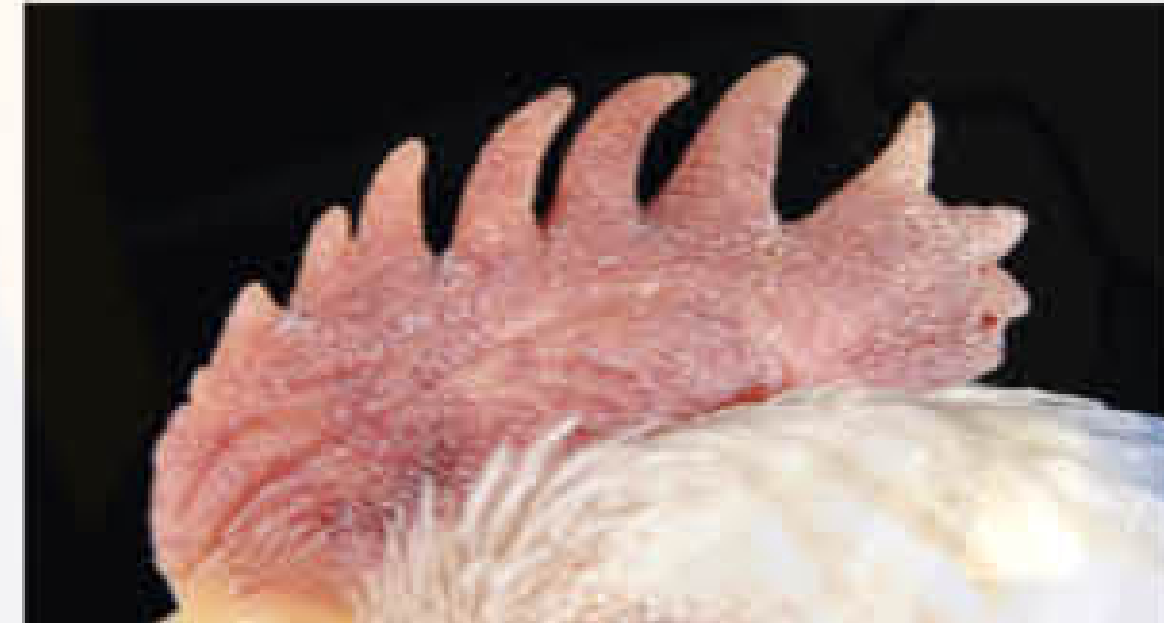
कलगी का बैंगनी या नीला होना