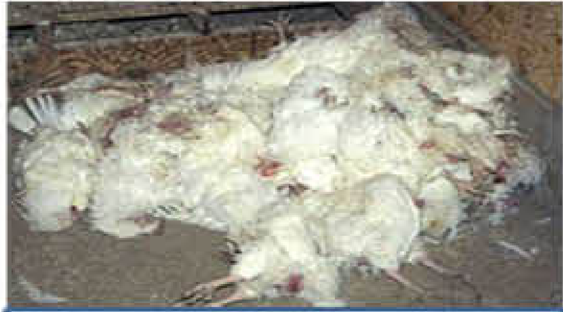
बिना किसी भी लक्षण के अचानक बहुत मौत